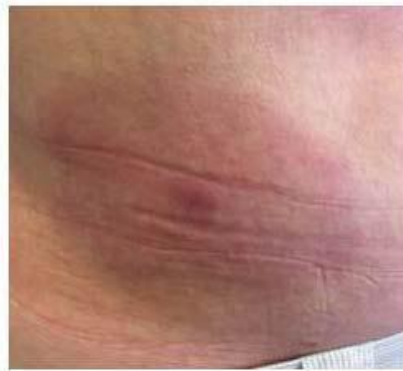
Eritema crónico migrans (Lyme)