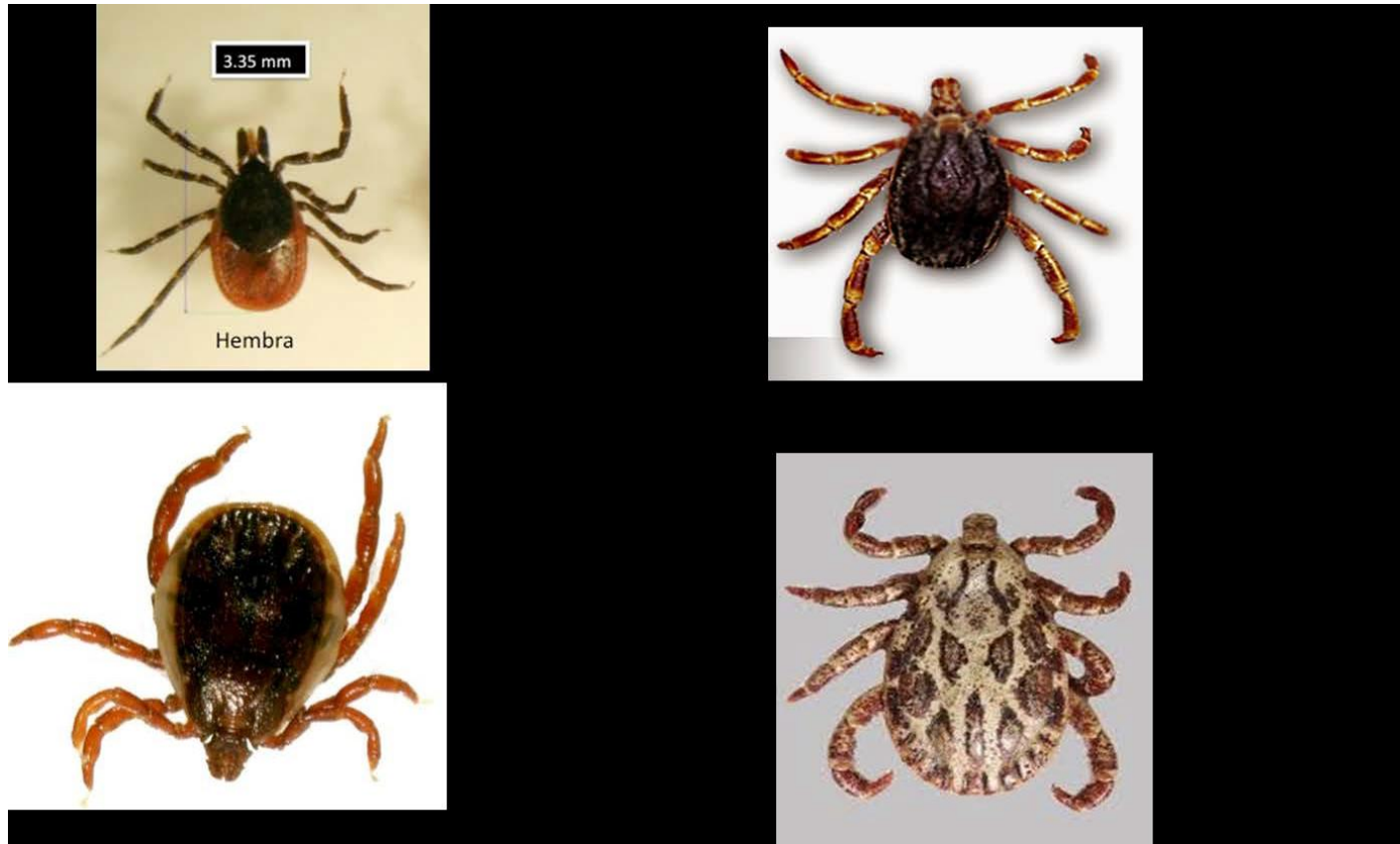
Figura 2: Garrapatas y enfermedades más frecuentes relacionadas con la picadura.

Ante un paciente que acuda con una picadura de garrapata se le explicará que el riesgo de desarrollar una enfermedad es mínimo, y solo en el caso de que presente signos y síntomas se seguirá un algoritmo que se adjunta en el anexo. En todo caso se le invitará a que mantenga la observación durante 4 semanas desde la fecha de la picadura (el máximo periodo de incubación de las EITG es de 32 días), indicando que si aparecen manifestaciones clínicas debe acudir a su médico.