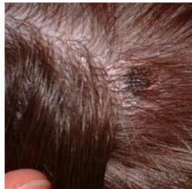
Escara necrótica (DEBONEL/TIBOLA)