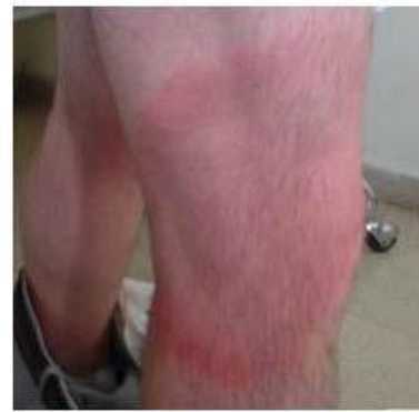
Eritema crónico migrans (Lyme)