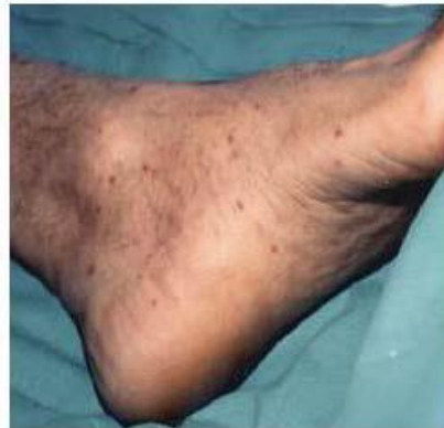
Exantema planta pie típico Fiebre botonosa