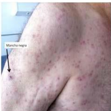
Escara y exantema de la Fiebre botonosa