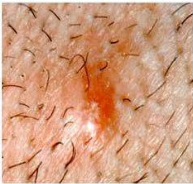
Pápula pruriginosa tras picadura garrapata